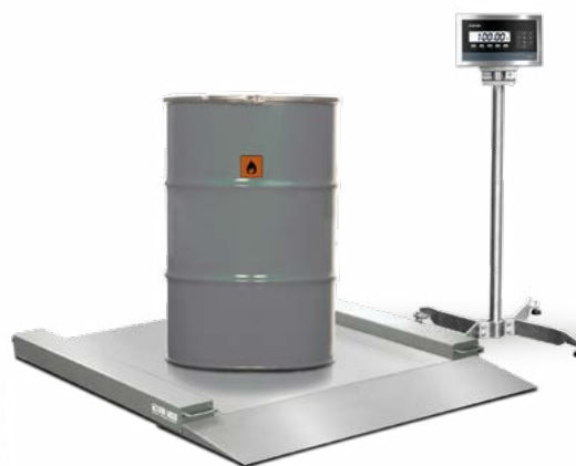
BILANCIA DA PAVIMENTO