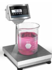
BALANCE DE COMPTOIR