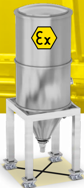
KITS ET CAPTEURS DE CHARGE

Version DFWIECEX-BATCH1, pour les processus de remplissage et de dosage